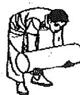
好ましくない姿勢

ロ 立位で人を抱え、身体の前方で保持する場合には、できるだけ身体の前方で支え(図 a)、腰の高さより上に持ち上げないようにする(図 b)。また、背筋を伸ばしたり、身体を後に反らしたりしないようにする(図 c)。